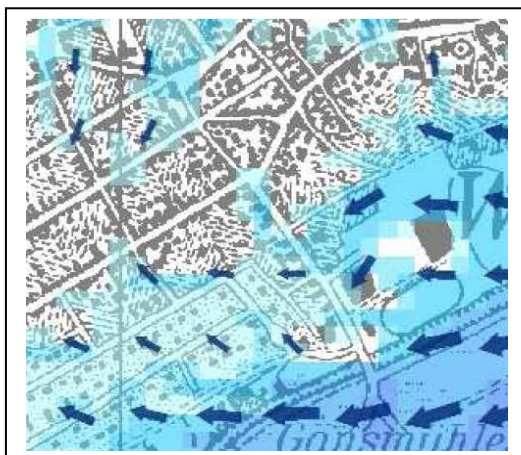
Nächtliches Strömungsfeld bei Inversionswetterlage