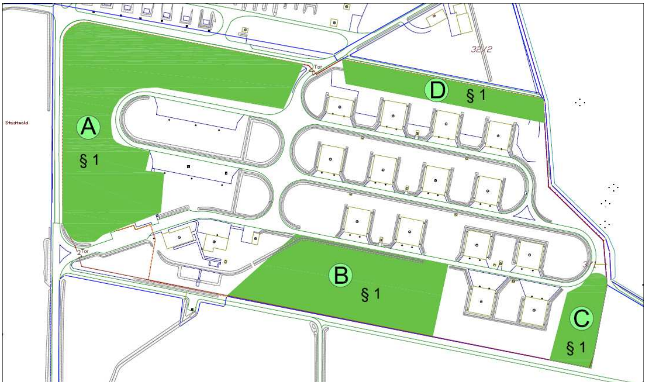
Abb. 2: Waldflächen gemäß § 1 ForstG HE

wandlung sowie für den vorgesehenen Waldumbau sind entsprechend § 12 und § 11 FORSTG HE Anträge bei den zuständigen Forstbehörden zu stellen.