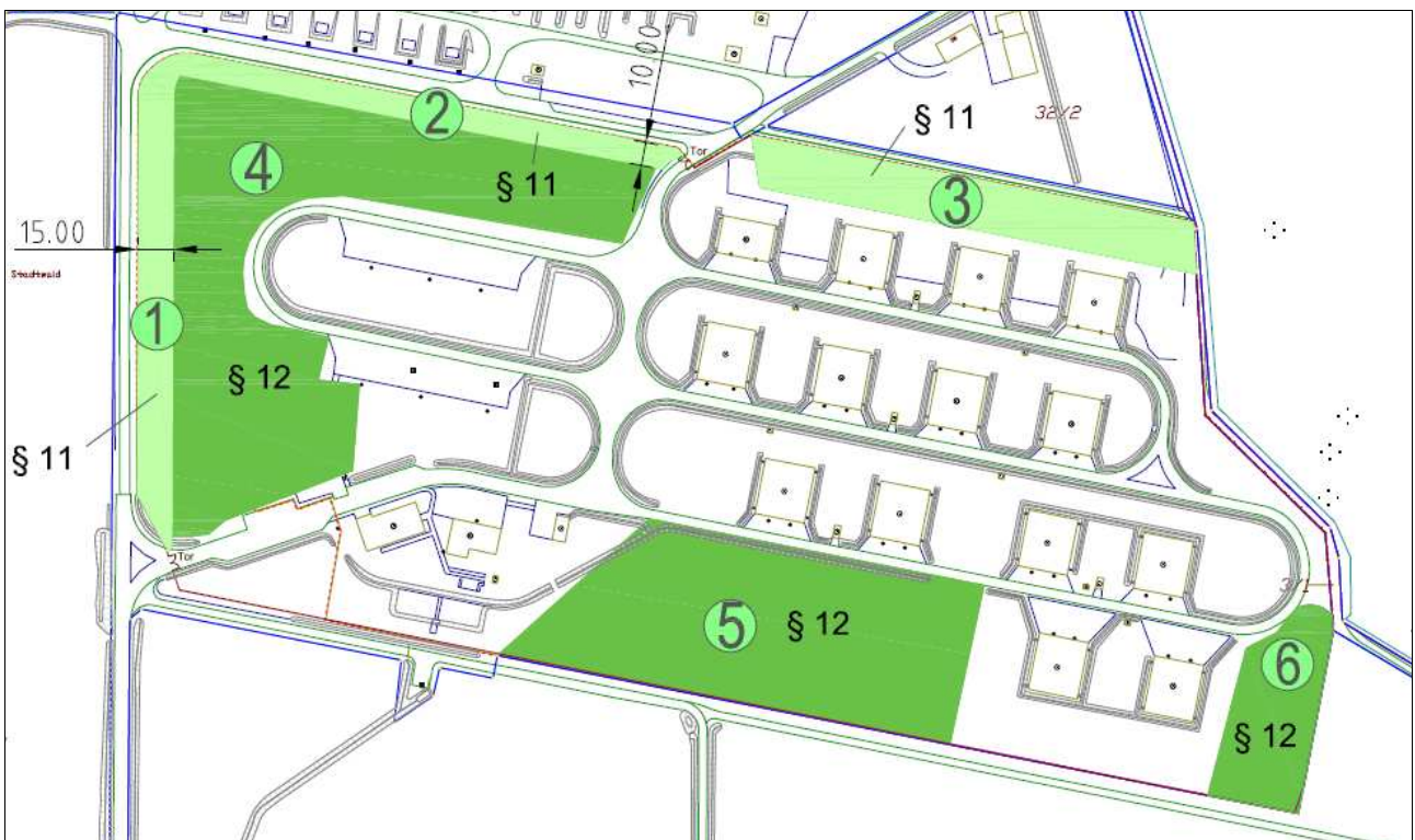
Abb. 3: Flächen gemäß Waldumwandlungs- bzw. Waldumbauantrag gemäß § 12 bzw. § 11 ForstG HE