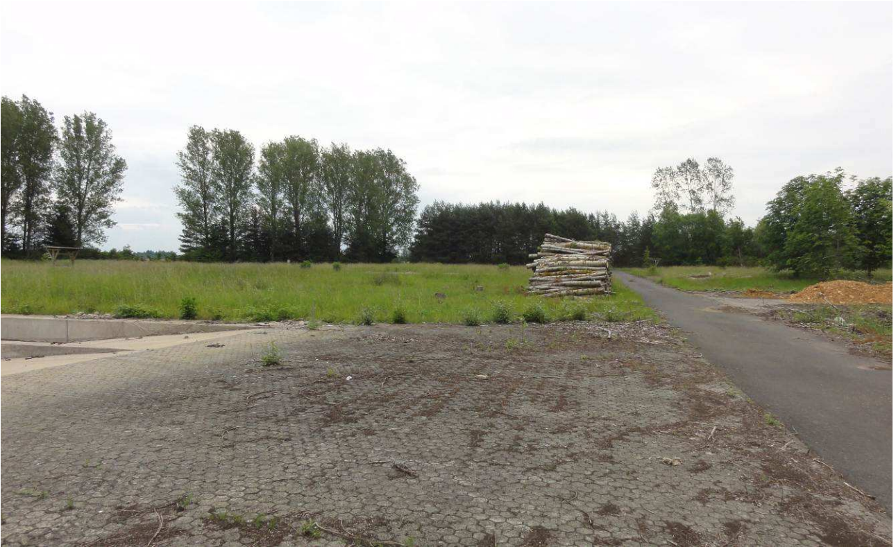
Abb. 5: Erschließungsstraßen und Reste der Treibstofflager

Das Landschaftsbild des Planungsraumes wird im Wesentlichen durch die vorhandenen Waldflächen sowie die weiteren Gehölstrukturen, wie Baumgruppen, Einzelbäume und Sukzessionsgehölze, bestimmt. Daneben wirken die baulichen Anlagen der militärischen Konversionsfläche, wie Gebäude, Straßen, Zaunanlage und die Reste der Treibstofflager, landschaftsbildprägend (s. Abb. 5 und 6).