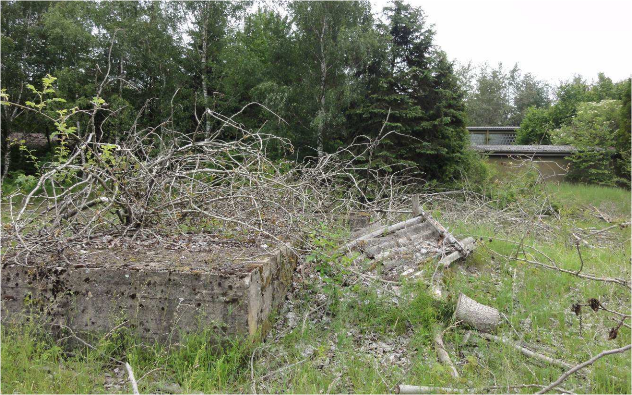
Abb. 6: Reste von baulichen Anlagen im Süden des Plangebietes