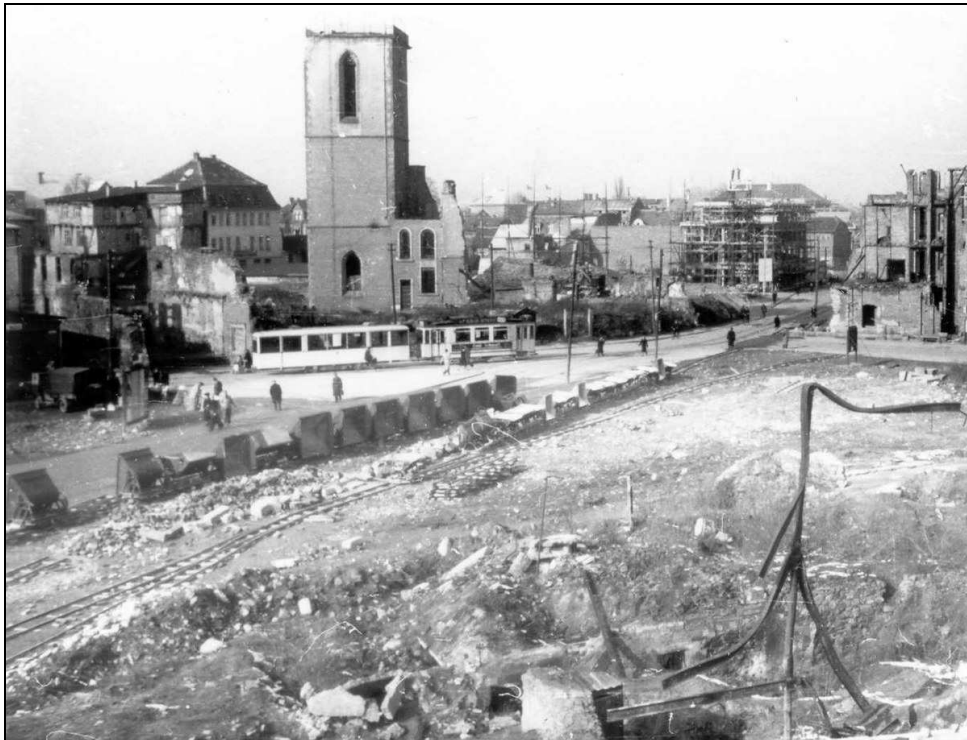
Abb. 3 Blick über den Marktplatz auf den Kirchenplatz n.d. Zerstörung i. 2. Weltkrieg

Im Zweiten Weltkrieg wurde die Kirche stark zerstört, so dass zunächst nur der Stumpf des Kirchturms erhalten blieb. Der Turm wurde in den 1980er Jahren einschließlich der barocken Turmhaube wieder vollständig hergestellt.