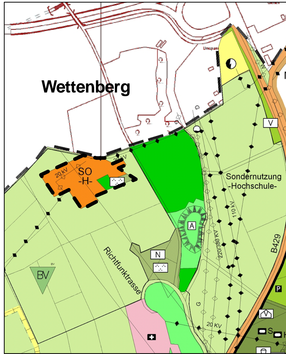
Darstellung alt (ohne Maßstab)