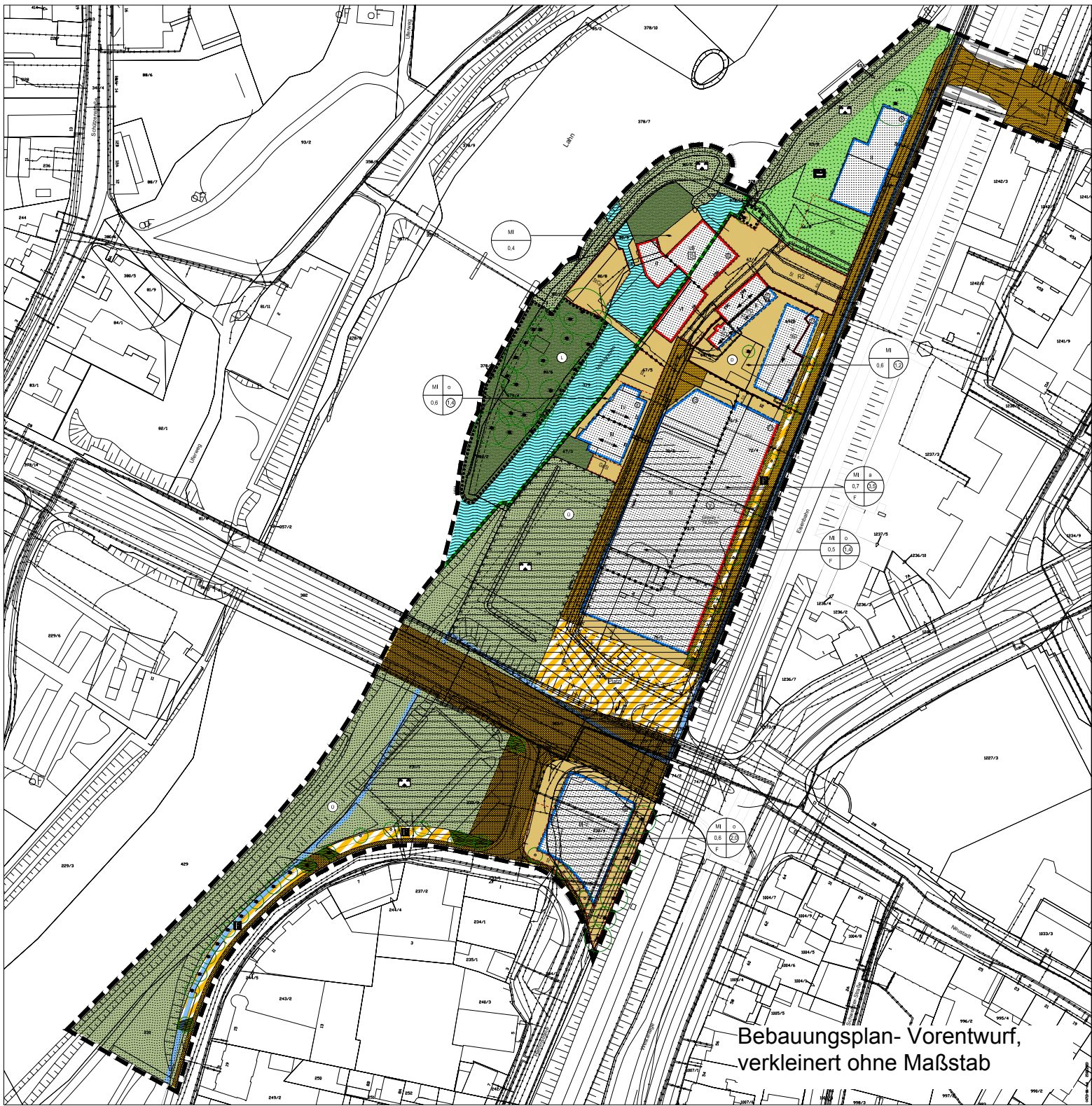
Bebauungsplan- Vorentwurf, verkleinert ohne Maßstab