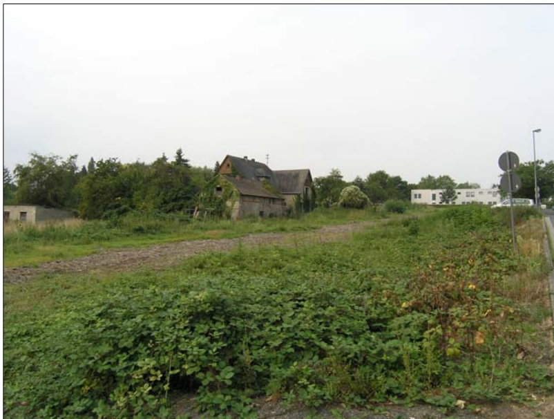
Abb. 4: Blick von Nordosten auf das Baufenster für das neue Chemikum.

Das Plangebiet wird von den baulichen Anlagen der Universität und den zugehörigen Freianlagen dominiert. Dabei finden sich auch ausgedehnte Grünflächen mit Vielschnitt- und Extensivrasen. Im südwestlichen Teil des Plangebiets sind z. T. sehr strukturreiche Nutz- und Ziergärten mit teilweise alten Obstbäumen vorhanden. Zwischen Heinrich-Buff-Ring und Schwarzacker befindet sich eine größere aufgelassene Fläche – hier soll das neue Chemikum entstehen. Die Fläche wurde offenbar im ersten Halbjahr 2009 gerodet, wie das zum Zeitpunkt der Begehung (10.08.2009) noch vorhandene Häckselgut zeigt. Größere Laub- und Obstbäume sowie ein Wohnhaus und mehrere Schuppen stehen noch auf dem Gelände.