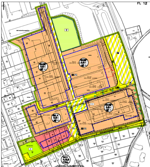
Abb. 2: Ausschnitt aus dem Bebauungsplan Nr. G 38 „Südviertel I“.

Der Geltungsbereich wird im Süden begrenzt durch die Straßen Schwarzacker, im Osten durch den Leihgesterner Weg und im Westen durch den Wartweg. Nördlich des Spielplatzes am Wendehammer verspringt die Geltungsbereichsgrenze hinter die Häuserreihe auf der Ostseite des Wartwegs. Kurz vor dem Tierhaus der JLU knickt die Geltungsbereichsgrenze nach Osten ab, schließt das Interdisziplinäre Forschungszentrum (IFZ) mit den sog. Hanggebäuden ein und folgt östlich des IFZ dem Böschungverlauf einer Grünanlage, bevor sie mit der Böschung wiederum nach Osten abknickt und über den Parkplatz bis zum Leihgesterner Weg verläuft.