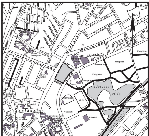
Übersichtsplan Geltungsbereich des Bebauungsplanes GI 02/06