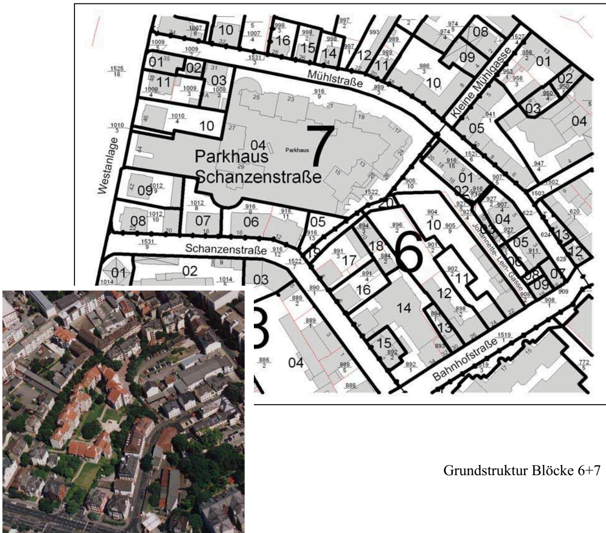
Grundstruktur Blöcke 6+7