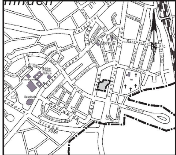
Übersichtsplan Geltungsbereich des Bebauungsplanes KL 09/05 2. Änderung