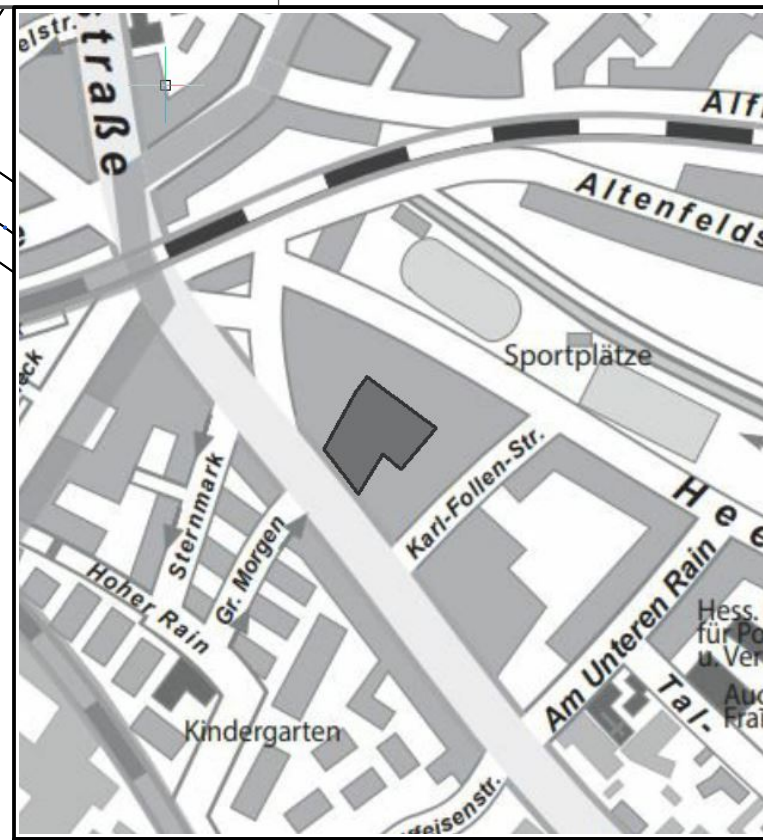
Übersichtsplan ■ Geltungsbereiches des Bebauungsplanes GI 04/33