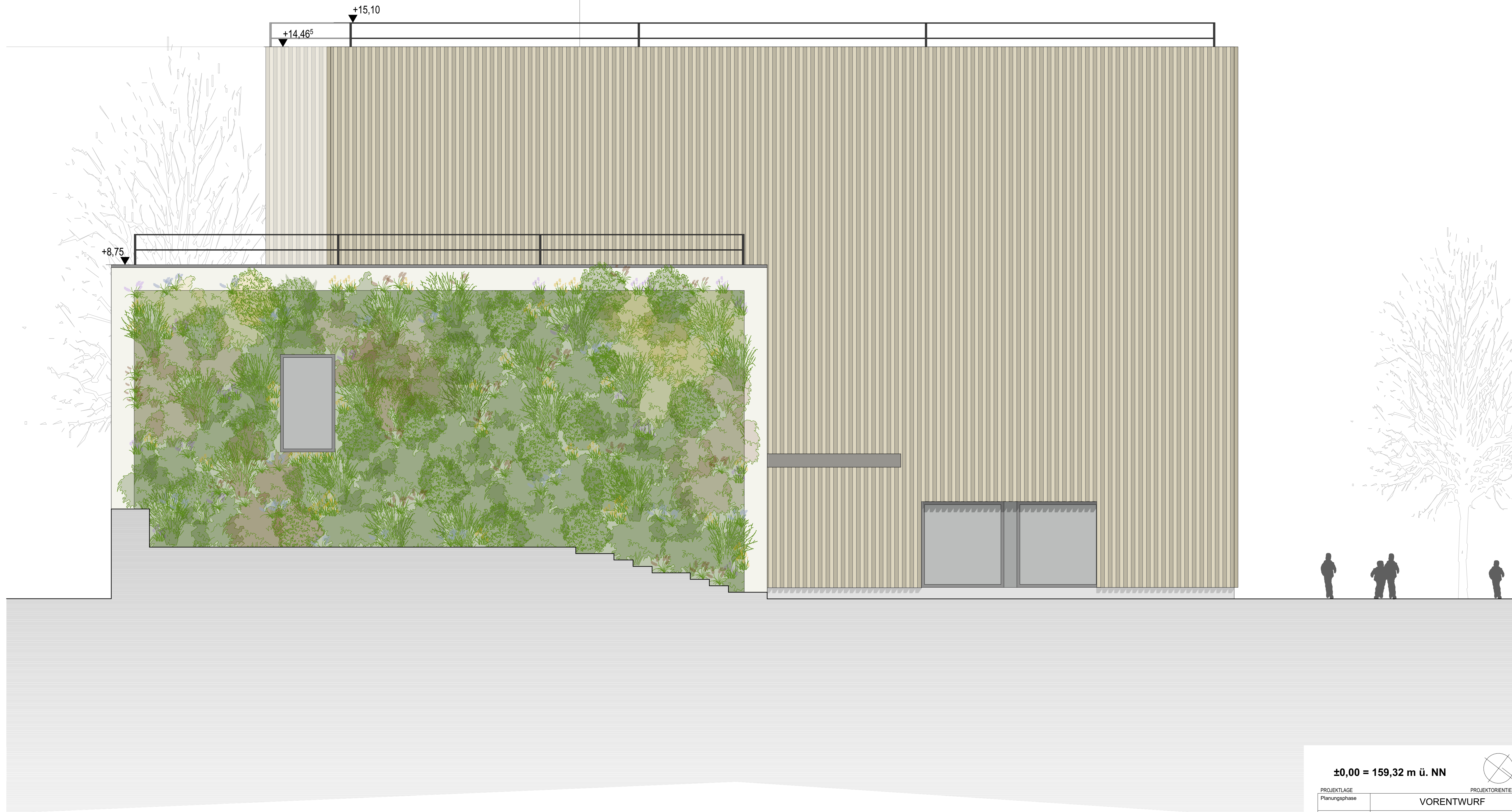
Ansicht Nord-West (von Ludwigstraße) M1:50