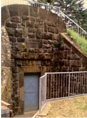
(Wasserhochbehälter „Am Kasimir“)

→ Nachhaltige Nutzung des alten Wasserhochbehältern am Kasimir als Fledermausquartier