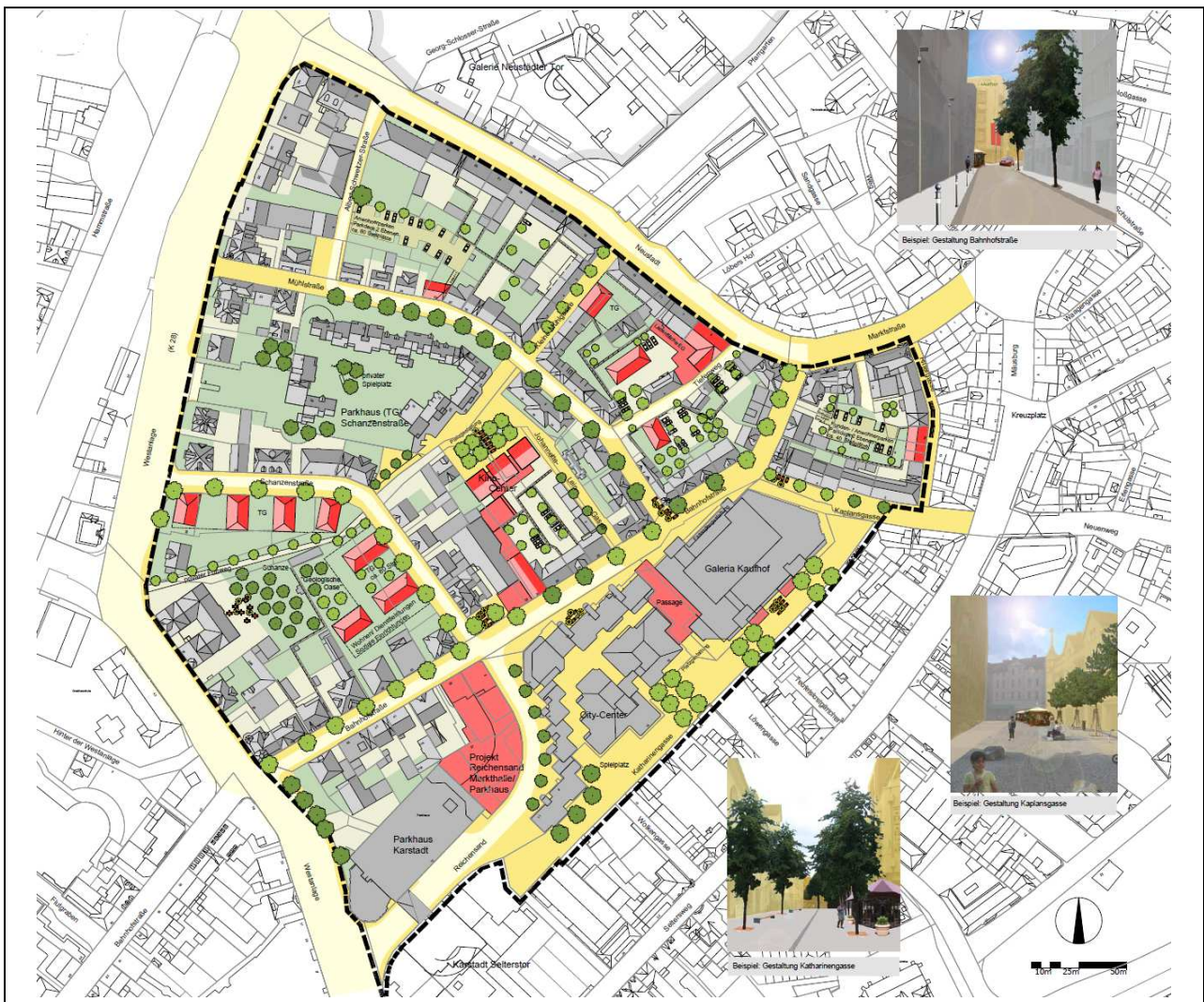
STADT GIEßEN / NASSAUISCHE HEIMSTÄTTE, Stand: 07/2005