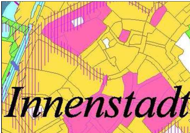
Wirkungs- und Ausgleichsräume, Luftaustauschbereiche (Auszug aus Klimafunktionskarte Klima-Luftanalyse Stadt Gießen 2014)