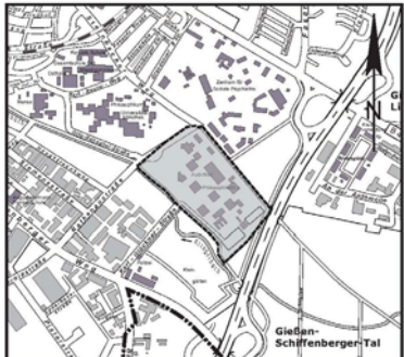
Übersichtsplan Geltungsbereich des Bebauungsplanes GI 04/30